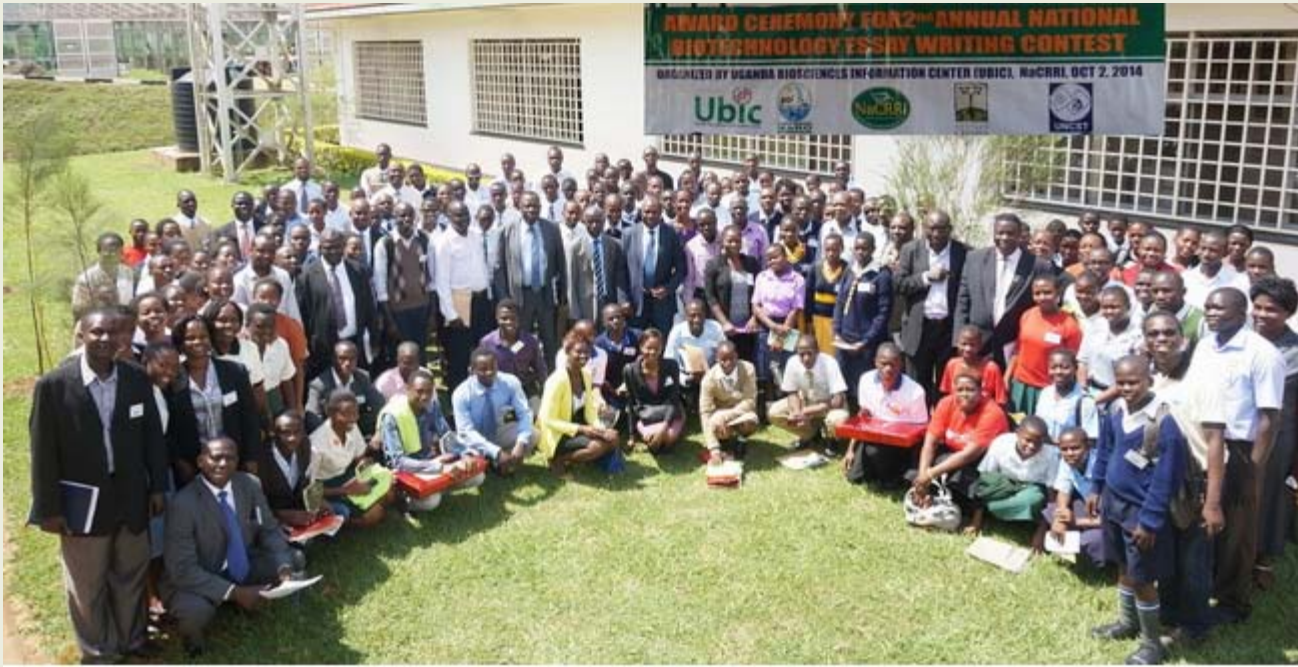
Participants at the second annual National Biotechnology Essay-writing Contest on 2nd October 2014